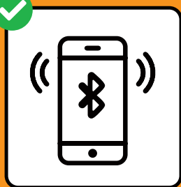
Um Infektionsketten zu stoppen: SwissCovid App downloaden und aktivieren.