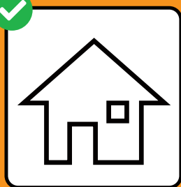
Bei positivem Test: Isolation. Bei Kontakt mit positiv getesteter Person: Quarantäne.