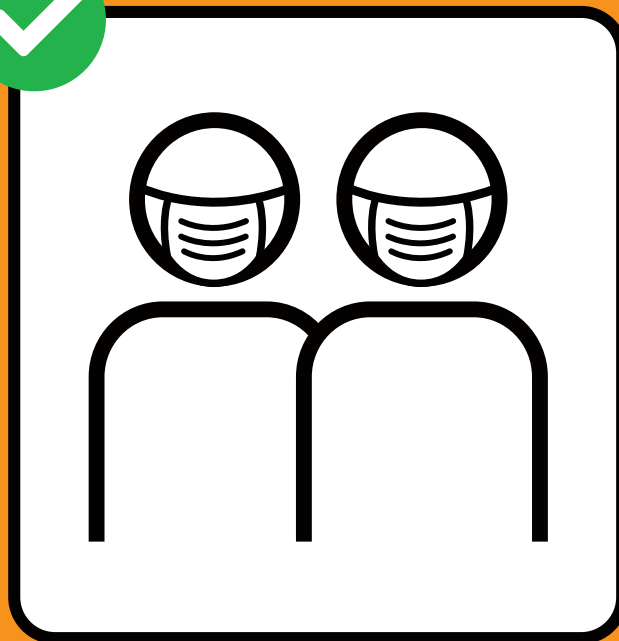
Maske tragen, wenn Abstandhalten nicht möglich ist.