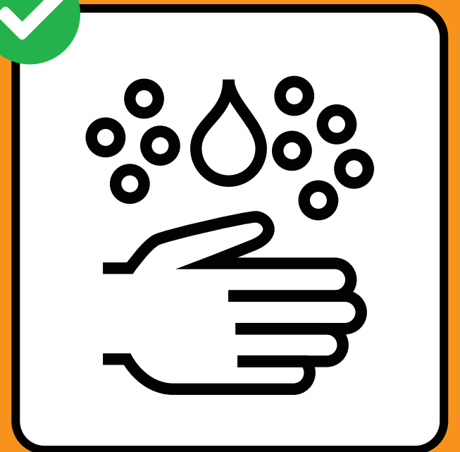
Gründlich Hände waschen.