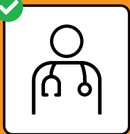
Bei Symptomen sofort testen lassen und zuhause bleiben.