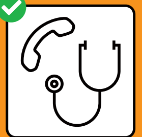
Nur nach telefonischer Anmeldung in Arztpraxis oder Notfallstation.