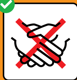
Hände schütteln vermeiden.