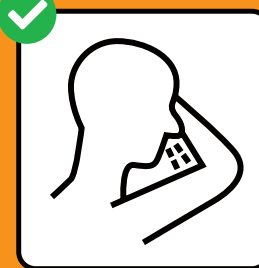
In Taschentuch oder Armbeuge husten und niesen.